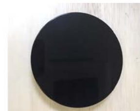
③ダッシュボード等に貼り付けます

* 貼り直しをすると吸着力が落ちます。設置場所をよく考え場所を選んでから貼り付けてください。貼り直しなどで吸着力が落ちた場合は市販の強力両面テープを代用してください。