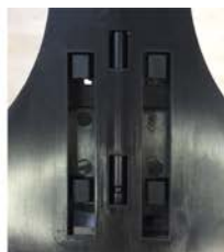
②マウントの4ヶ所の爪をクレードルに入れます