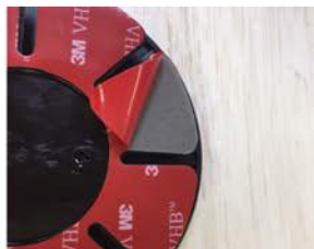
②赤い面を剥がします