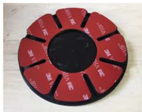
①同梱の両面シールを台座側に貼ります