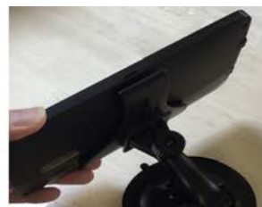
②ナビ本体をクレードルの下の爪に合わせ、上の爪でカチッと固定します