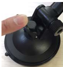
①台座に吸盤を載せてレバーを手前に倒して固定完了です