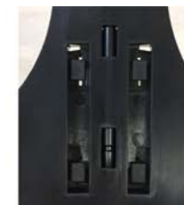
③クレードルを下にスライドさせて爪を固定させます