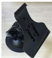
①クレードルの広い面が下になります